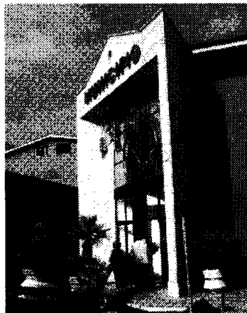
Il Comune di Ciampino

«Vorrei evidenziare, senza presunzione, che siamo l'unica opposizione se pur privi di una rappresentanza in Consiglio comunale. Il Pdl, forte dei suoi consiglieri, riesce solo a fare molte