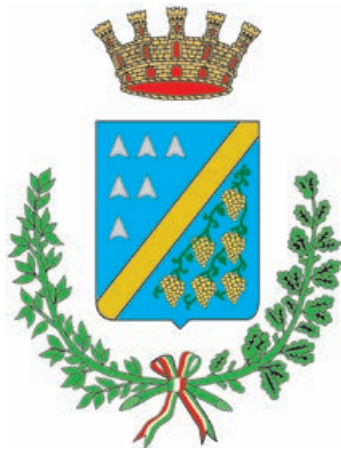
A. Città di Ciampino

Il carattere istituzionale: Garamond Premier Pro o in sostituzione Times New Roman