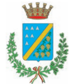
Città di Ciampino