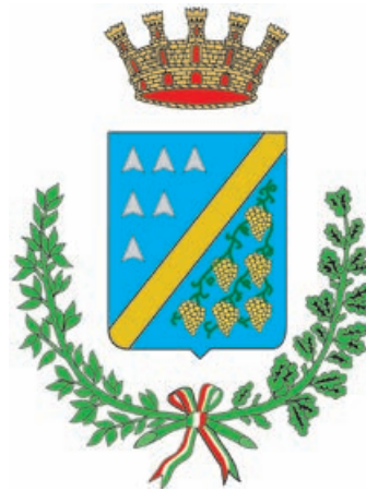
B. Città di Ciampino