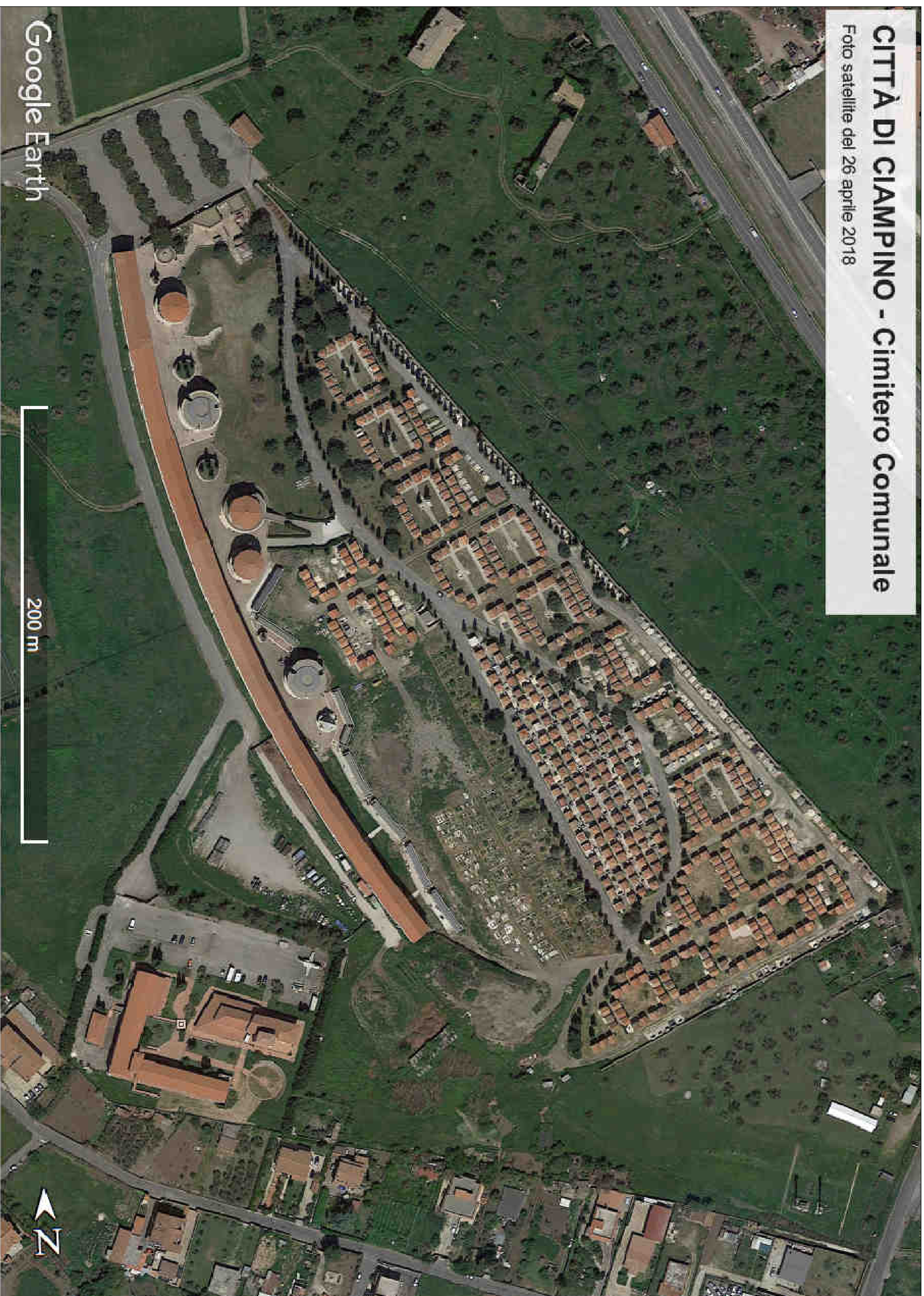
Foto satellite del 26 aprile 2018